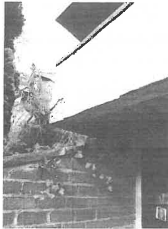
Te herstellen luifel, beschadigd door onderliggend betonrot