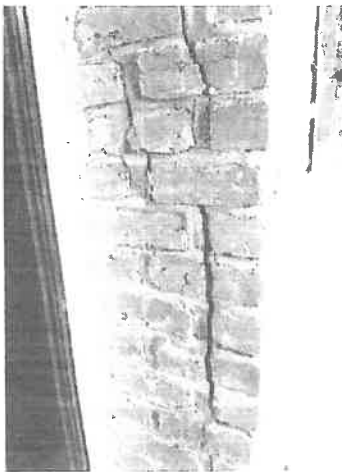
Hervoeegen van de gevel waar nodig