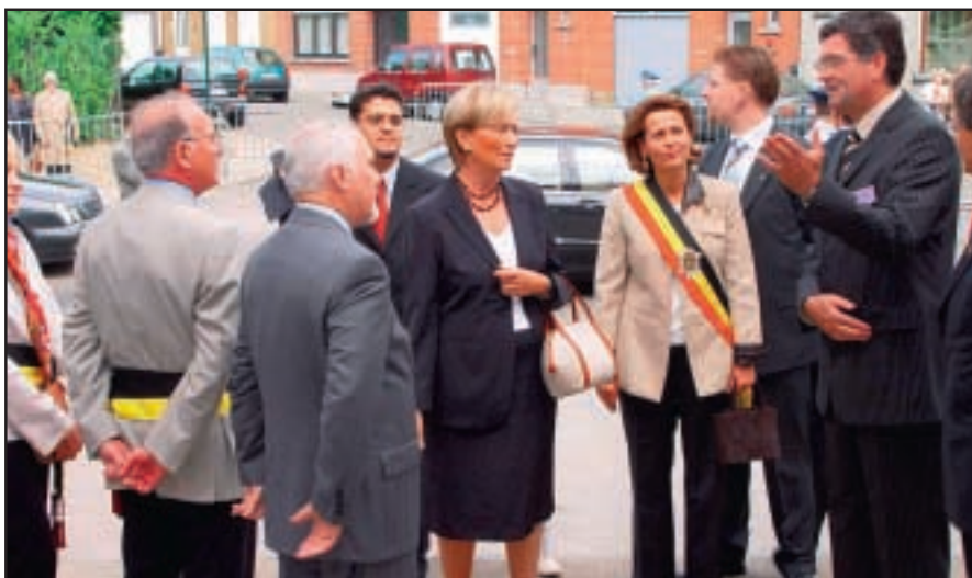
Accueil par les responsables de la Résidence Arcadia Onthaal door de verantwoordelijken van rusthuis "Arcadia"

Bij haar aankomst in rusthuis "ARCADIA", gelegen in de Ferdinand Elbersstraat nr. 20, werd Hare Majesteit de Koningin onthaald door de verantwoordelijken van het OCMW en van het rusthuis die haar een prachtige bloemenruiker overhandigd hebben. Onze Koningin heeft vervolgens de kamers bezocht van de bejaarden die in behandeling zijn, waar ze met verscheidene onder hen heeft kunnen praten. Rusthuis «Arcadia», dat in de jaren '60 opgericht werd, werd door middel van aanzienlijke renovatie- en uitbreidingswerken gemoderniseerd, en telt 249 bedden. In totaal bestaat het personeel uit zo'n 110 mensen, rekening houdend met alle specialisaties. Naast de slaapkamers of flats, die modern uitgerust en aangepast zijn, kunnen de bejaarden van het rusthuis met name genieten van een aangename cafetaria, verscheidene woonruimtes, een zaal voor ergotherapie en een spektakelzaal, waar ontspanningsactiviteiten georganiseerd worden. De Koningin heeft haar bezoek beëindigd door de bejaarden in de cafetaria's te ontmoeten. Na afscheid van hen te hebben genomen, heeft onze Koningin zich naar het Karreveldkasteel begeven, om er de Koning te vervoegen voor een receptie waarop de lokale overheid aanwezig was.