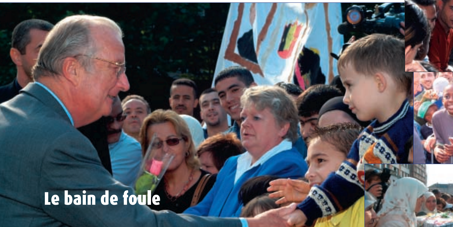
Le bain de foule