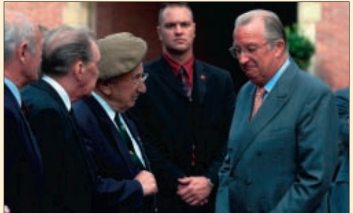
Rencontre avec les anciens combattants Ontmoeting met de oud-strijders