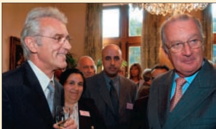
Rencontre avec des conseillers communaux PS et Ecolo Ontmoeting met gemeenteraadsleden van de "PS" en van "Ecolo"

Dit was ook de gelegenheid om kennis te maken met de jonge leerlingen van het project "AFT HORECA" (Atelier de Formation par le Travail), die vele gerechten klaargemaakt hadden om de smaakpapillen van ons vorstenpaar te verwennen. Nadat ze samen het glas hadden geheven, werd deze prachtige voormiddag met een traditioneel afscheid op de binnenplaats van het Karreveldkasteel afgerond. Dit koninklijk bezoek zal ons nog lang bijblijven en is volledig vlekkeloos verlopen. We willen Zijne Majesteit de Koning en Hare Majesteit de Koningin van harte bedanken!