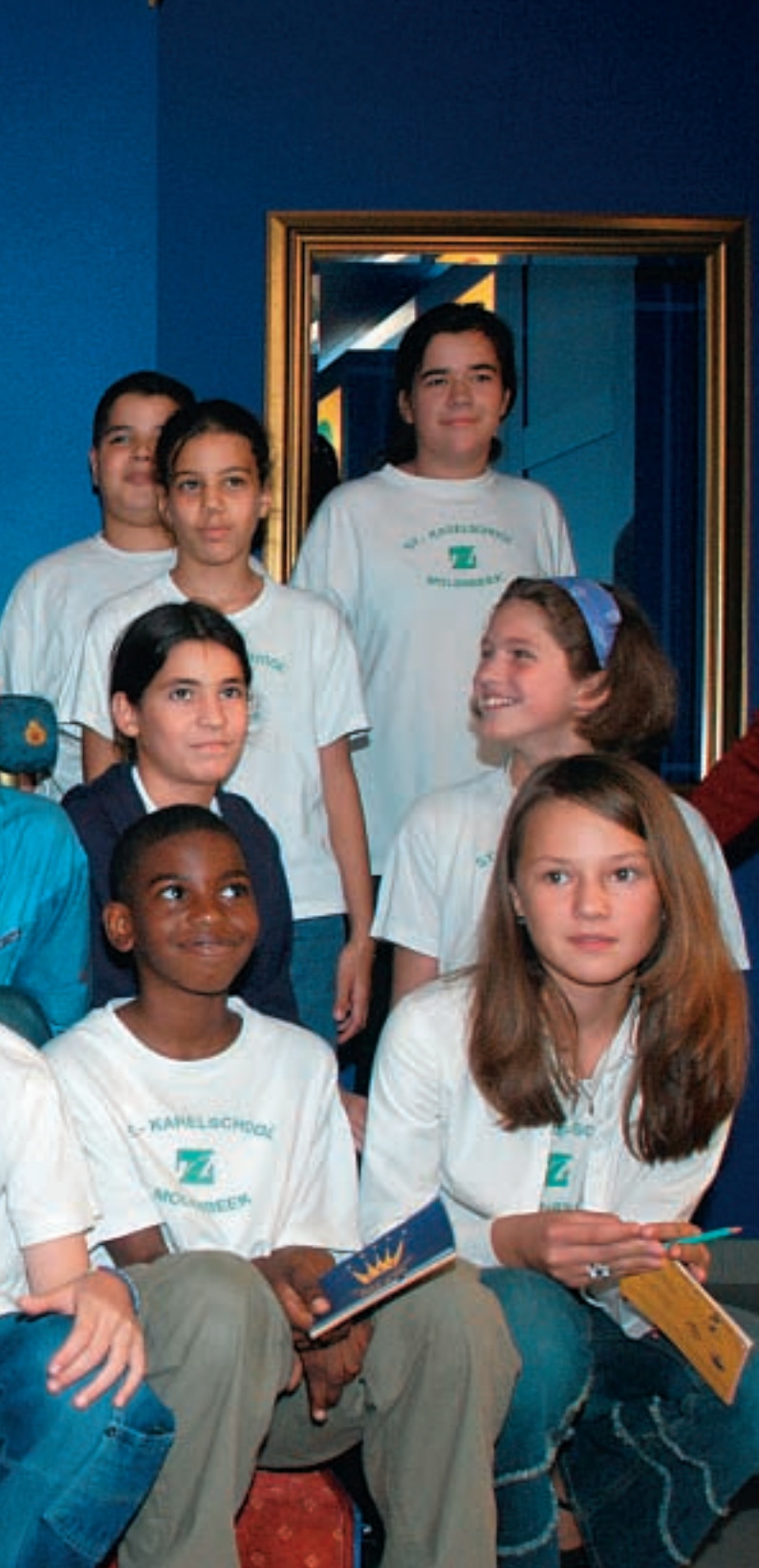
Entretien avec des jeunes du « Palais du Normal et de l'Étrange » Onderhoud met jongeren van "Het gewone vreemde paleis"

In dit paleis heeft de Koning een troon ontdekt waarin hij met plezier even voor een foto geposeerd heeft, in het gezelschap van de talrijke kinderen die aanwezig waren. Na zijn bezoek aan het paleis, heeft de Koning zich naar het Karreveldkasteel begeven, waar hij de Koningin vervoegd heeft om een receptie bij te wonen waarop de lokale overheid aanwezig was.