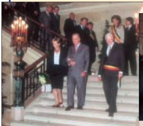
A la Maison communale In het gemeentehuis