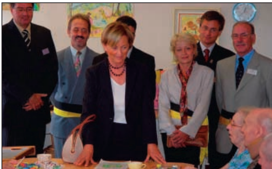
Visite de la Reine dans l'espace "Ergothérapie" Bezoek van de Koningin aan de ruimte voor ergotherapie