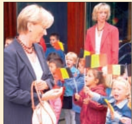
Visite de l'Ecole 16 et des responsables scolaires Bezoek aan School 16 en de onderwijsverantwoordelijken