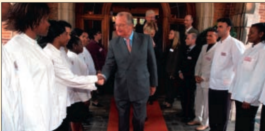
Félicitations aux élèves de l'AFT Horeca - Proficiat aan de leerlingen van "AFT Horeca"