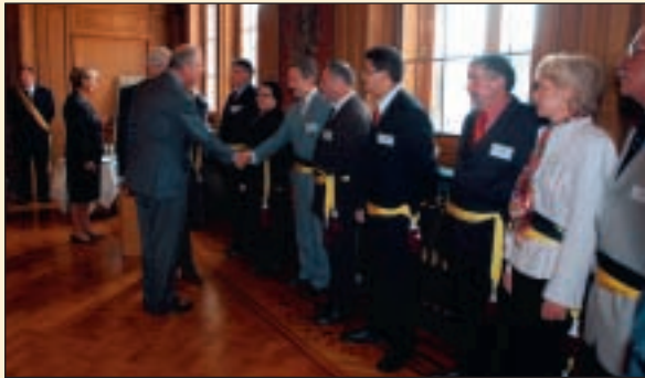
Rencontre avec les responsables communaux Ontmoeting met de gemeentelijke verantwoordelijken