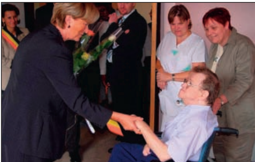
Rencontre avec les personnes de la Résidence Ontmoeting met de mensen van het rusthuis