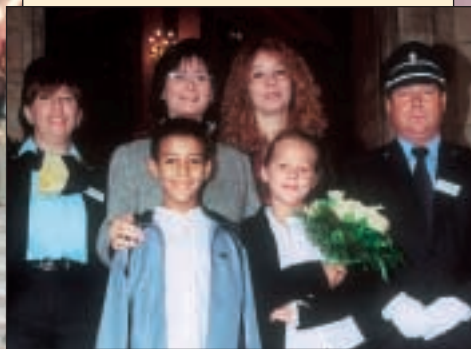
Quelques fans - Enkele fans