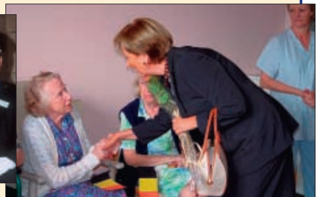
Visite des pensionnaires de la Résidence Arcadia Bezoek aan de bewoners van rusthuis "Arcadia"