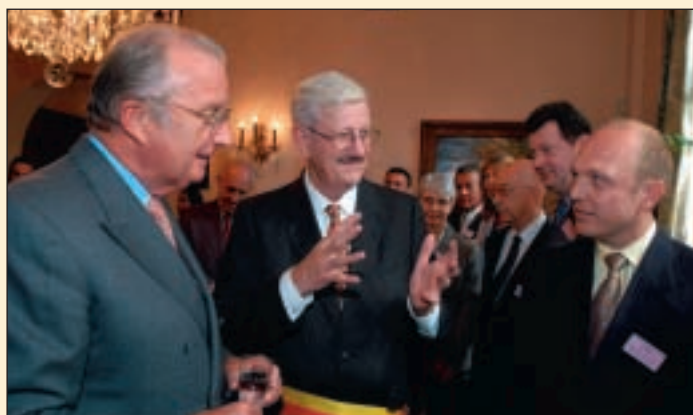
Rencontre avec des conseillers communaux MR Ontmoeting met gemeenteraadsleden van de "MR"