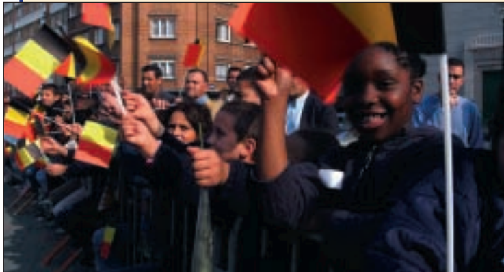
Les Molenbeekois attendent le Roi et la Reine De Molenbekenaren wachten op het vorstenpaar