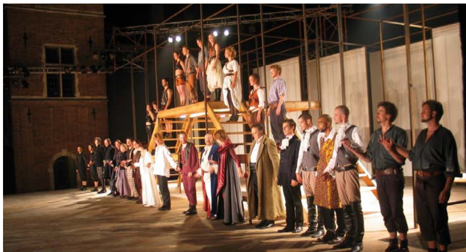
La grande scène en plein air

Infos: service communal de la Culture française au 02 415 96 12