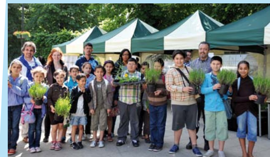
Les jeunes de la Maison de Quartier Libérateurs lors de la distribution des fleurs au Square des Libérateurs

Question nourriture, tout le monde se mobilise. Commerçants, habitants, maisons de quartier, associations et écoliers fleurissent les pieds d'arbres du quartier Maritime avec des fleurs de leur choix ou avec les fleurs sauvages mellifères (qui favorisent la production de miel,