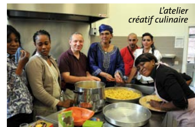
L'atelier créatif culinaire

Le Festival aura permis de mieux apprécier un patrimoine souvent méconnu et par là même, de promouvoir la culture comme facteur de rapprochement entre les peuples. En l'occurrence, le choix du lieu de la manifestation - la Maison des Cultures - était approprié !