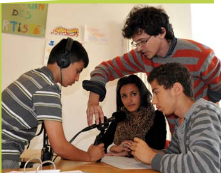
Vérification technique avant l'enregistrement

«Micro-Ondes», l'atelier de web-radio mené avec les jeunes en collaboration avec le Gsara.