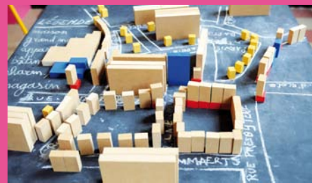
Maquette au retour d'un voyage à travers Molenbeek

Bravo ! Ecole 1 « La Rose des Vents », Ecole 2 « Emeraude », Ecole 5 « Ecole Chouette », Ecole 7 « Arc-en-Ciel », Ecole 10 « La Cité des Enfants », Ecole 11 « Aux Sources du Gai Savoir », Ecole « Windekind », Ecole « Windroos »