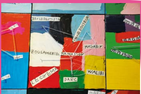
Exposition à la Maison des Cultures et de la Cohésion sociale