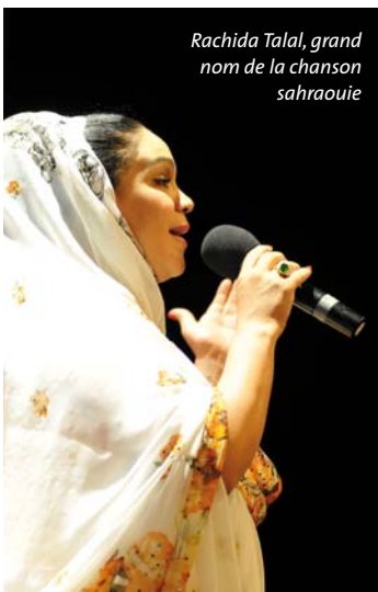
Rachida Talal, grand nom de la chanson sahraouie