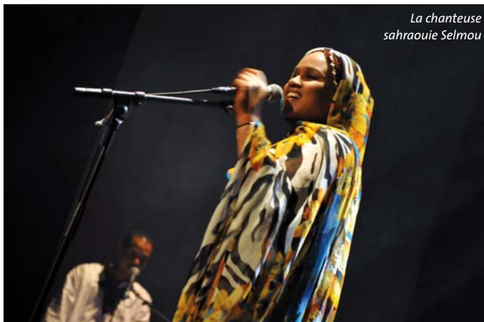
La chanteuse sahraouie Selmou