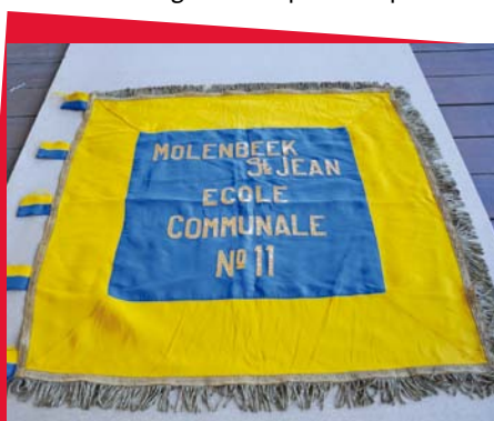
A l'instar des associations du passé, les écoles communales avaient leur drapeau. Ici, celui de l'Ecole n° 11.