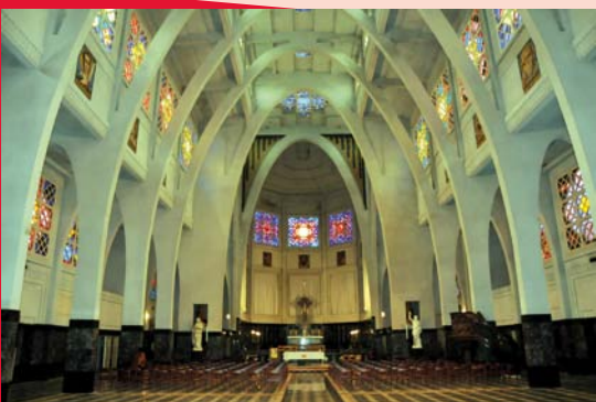
Parmi les monuments remarquables, l'église Saint-Jean-Baptiste a été rénovée en profondeur

Nous voilà au Printemps, l'occasion de fréquenter les parcs publics : au Parc des Muses, plusieurs jeux pour enfants seront remplacés et des aménagements seront réalisés dans le site semi-naturel du Scheutbos. Notons aussi l'aménagement de locaux pour les gardiens de la Paix au boulevard Mettewie et à la Place de la Duchesse. Parmi les monuments remarquables tel celui de l'église Saint-Jean-Baptiste, les travaux sont terminés prochainement. Quant aux galeries funéraires du cimetière communal, elles seront restaurées courant 2011.