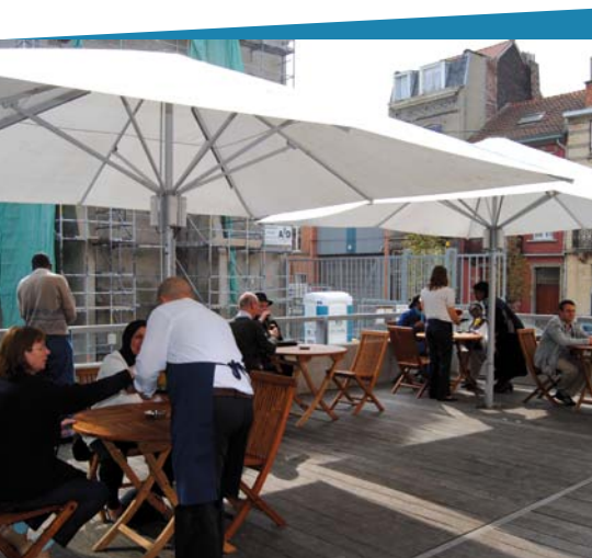
« Le Marmitime » vous ouvre sa terrasse qui invite à plus de détente et de farniente

« Le Marmitime » Café-Resto: rue Vandenboogaerde, 93 à 1080 Bruxelles. Tél. : 02 421 16 05 marmitime@mofa.irisnet.be Ouvert de 8 h 30 à 16 h 30 du lundi au vendredi. Tarifs : de 2 à 10 euros