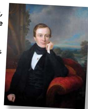
2° Un splendide portrait apparemment d'un membre de la famille des Bonaparte par M.G. Stapleaux, récemment revenu de restauration (sans date [début 19e siècle]). Coll. communale, inv. n° 72.

MOMUSE - Musée communal de Molenbeek-Saint-Jean: rue Mommaerts, 2A 1080 Bruxelles. Tél.: 02 414 17 52 E-mail: info@momuse.be