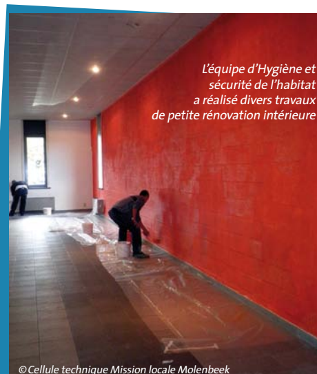
L'équipe d'Hygiène et sécurité de l'habitat a réalisé divers travaux de petite rénovation intérieure

des Travaux publics et des Ateliers communaux, de manière à ne pas faire doublon et à être bien coordonnés. Une belle expérience qui redonne de l'espoir.