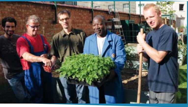
Nouveau jardin potager à côté du restaurant social « Les Uns et les Autres »