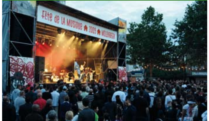
20/06/09 : Muziekfeest op het Sint-Jan-Baptist Voorplein