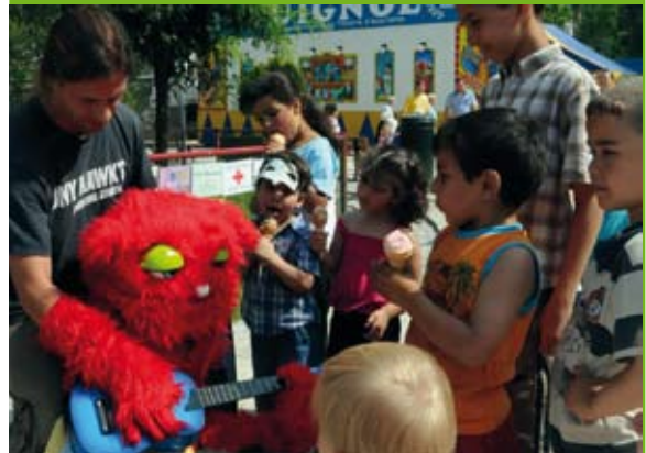
28/06/09 : Marionettenfestival met de dienst Jeugd Marie-Josépark