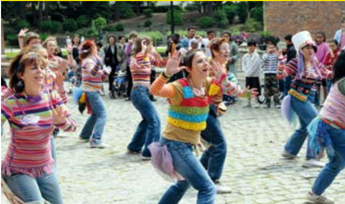
20/06/09 : Muziekfeest in het Karreveldkasteel