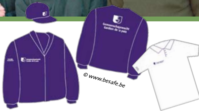
Nouvel uniforme des Gardiens de la Paix à partir de 2010