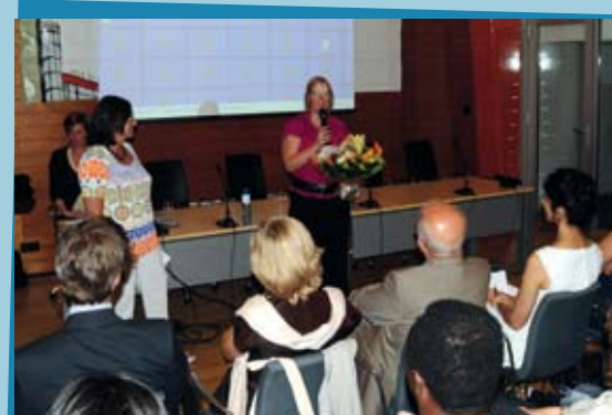
LeSAMPA a gagné le 1er prix « Accueil entraide migrant(e)s » de la Fondation Roi Baudouin

Loin de se reposer sur ses lauriers, le SAMPA va poursuivre plusieurs projets comme « Sport au féminin », soutenu par la Région bruxelloise.