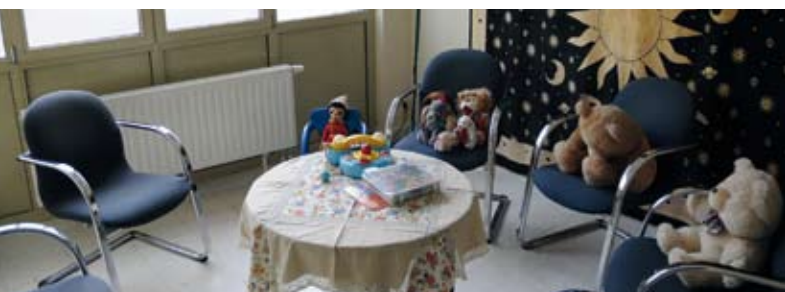
Nouveaux locaux du SCAV et de la Médiation locale

Gardiens de la Paix : rue du Comte de Flandre, 15 – Tél. : 02 422 06 70 (centrale)