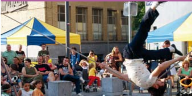
04/07/09 : O'DE MOLENBEEK – Festival de théâtre de rue Culture néerlandophone