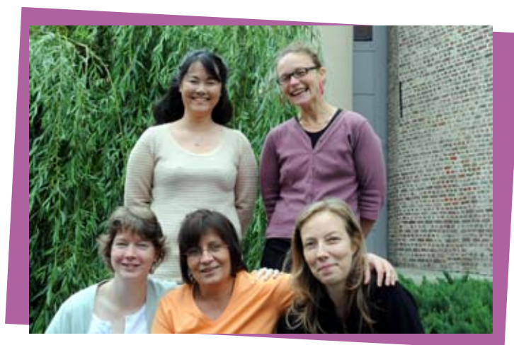
L'équipe de la Cellule de veille contre le décrochage scolaire

Info : rue du Comte de Flandre, 15 (bâtiment Ajja). Tél.: 02 422 06 11