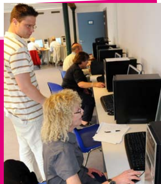
Atelier informatique « Molem.net » de la CLES (Ajja, rue du Comte de Flandre, 15)

Pour tous renseignements sur les chèques-sport, les sports et clubs existants à Molenbeek, contactez le service des Sports : 02 412 37 36