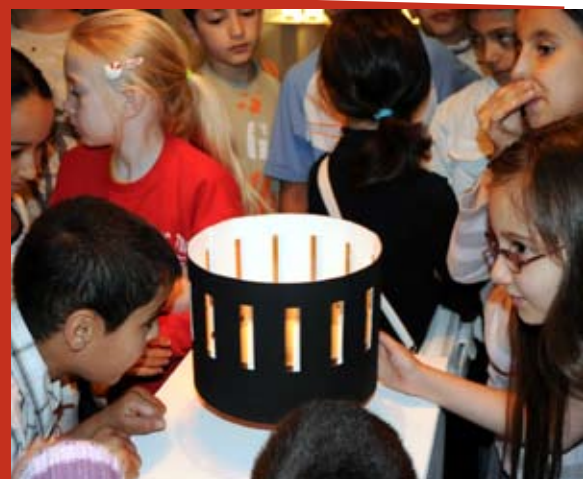
Les enfants de nos écoles ont travaillé autour du thème « Ombre et lumière »

Info : rue Mommaerts, 4. Tél.: 02 415 86 03 mccs-hcss.info@molenbeek.irisnet.be