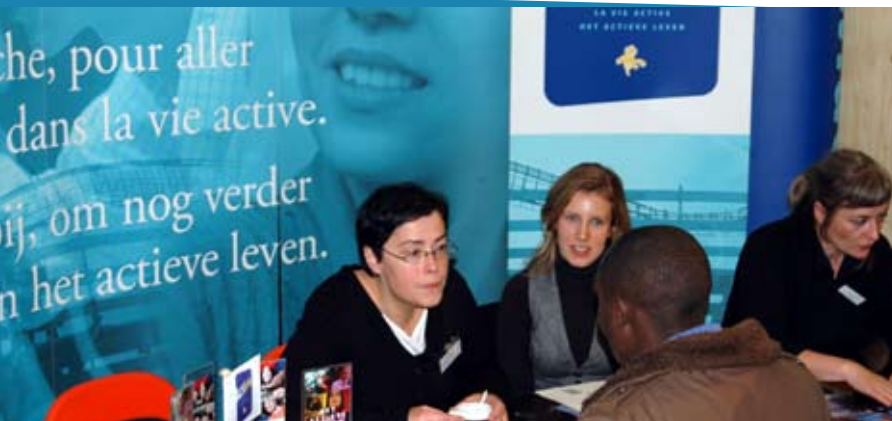
Journée « PASS Formation/Emploi » en décembre 2008