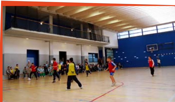
Nombreuses activités sportives toute l'année avec la CLES SPORT (Salle Decock)

Cette nouvelle manière de travailler s'est imposée du fait que la CLES Sport a évolué sur un autre aspect : au départ, les animateurs ne disposaient d'aucun lieu ou presque. Actuellement, ils gèrent 2 salles (Intendant et Decock) et 3 espaces sportifs (Dubrucq, Saint-Remy et Pierron). Chaque équipe dispose de locaux pour accueillir les parents en recherche de renseignements ou qui souhaitent inscrire leur enfant. L'équipe du Pierron/Centre dispose d'un local à l'Espace Pierron (quai du Hainaut) et l'équipe du quartier Maritime dispose de locaux au 82, avenue Jean Dubrucq.