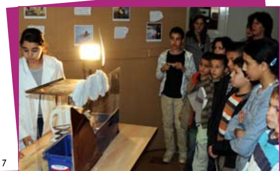
« Terre, terre on te perd ! », exposition-théâtre des enfants des écoles 5 et 7