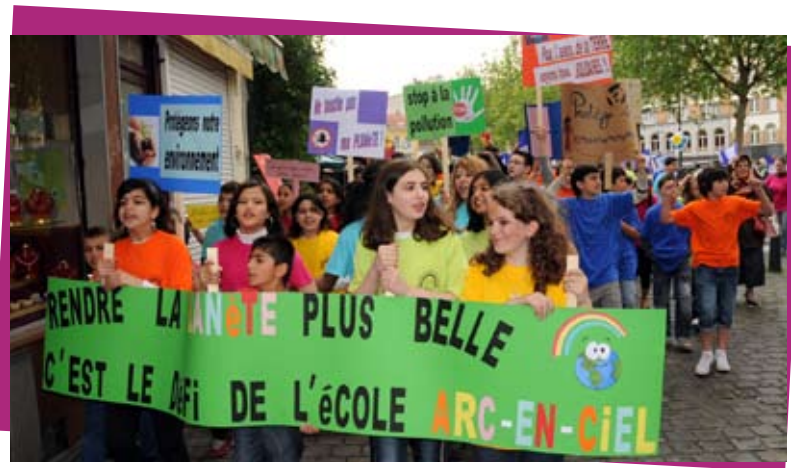
« Donnons des couleurs à notre quartier » avec les enfants des écoles 7 & Tamaris

Dans le contrat de quartier « Ateliers - Mommaerts » (2005-2009), les élèves de 5e et 6e de l'école 7 sont devenus des ambassadeurs de la citoyenneté. Pendant 3 ans, ils ont agi au sein de « leur » mini-contrat de quartier via le projet « Je donne des vitamines à mon quartier ! » qui leur aura permis de sensibiliser les adultes au problème des dépôts clandestins et des sacs plastiques, intéresser leur école au tri des déchets, verduriser leur environnement, ... Ils ont aussi composé leur propre hymne et élaboré un jeu de coopération. Autant de manières d'apprendre la citoyenneté dès le plus jeune âge.