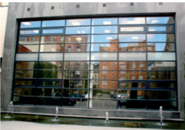
Le «Crystal Palace», l'endroit idéal pour Teleperformance

Tegenover deze nieuwe noden, vormen de human resources en de aanwerving van personeel essentiële troeven: onze groep is voortdurend op zoek naar nieuw talent, zegt Guillaume Baude verder. En we hebben vooral meertalige personen nodig die in staat zijn zich aan een internationale omgeving aan te passen. Maar we staan ook open voor mensen zonder diploma zolang ze maar heel gemotiveerd en werkelijk gepassioneerd zijn door communicatie.