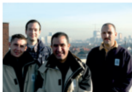
La cellule «Environnement-Propreté» De cel «Leefmilieu-Netheid»

Nos actions ont surtout visé à supprimer les dépôts clandestins et à faire respecter le règlement communal en matière de propreté, poursuit le coordinateur. Pour y parvenir, nous avons, par exemple, mené plusieurs actions de sensibilisation des habitants à l'importance du tri des déchets. Les nombreux contacts avec les riverains nous ont montré qu'ils s'impliquent davantage pour maintenir leur quartier propre. Ensemble, nous pouvons, avec du temps et de la patience, changer les choses. Comme pour le problème des déjections canines qui tend depuis lors à diminuer, en partie via des canisites placés à des endroits stratégiques.