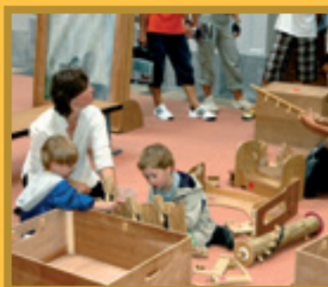
Maison des Cultures et de la Cohésion sociale Huis van Culturen en Sociale samenhang