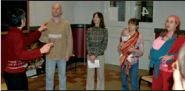
La chorale de la Maison des Cultures (vendredi midi) Het koor van het Huis van Culturen (vrijdagmiddag)