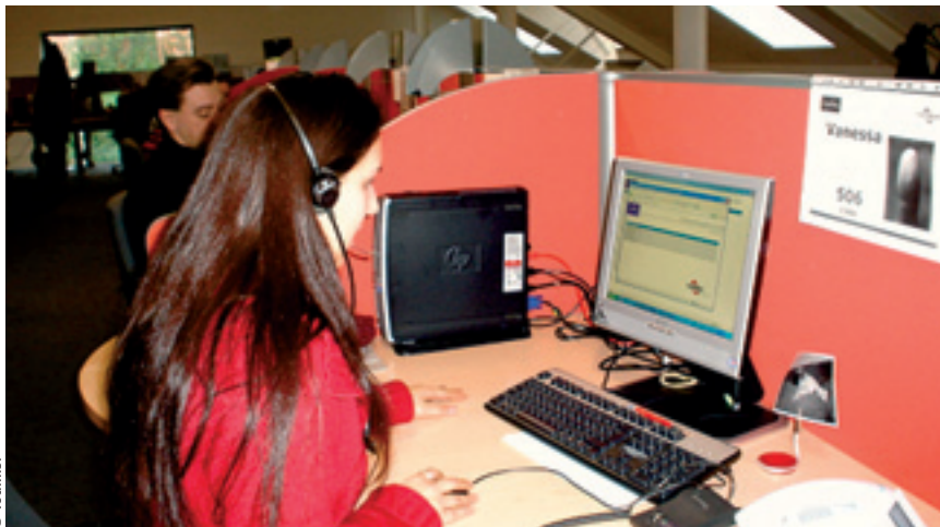
«Teleperformance», leader mondial sur le marché des call centers

Qui dit développement dit recherche de nouveaux collaborateurs. Le groupe représente donc un « + » indéniable pour l'emploi des Bruxellois en général et des