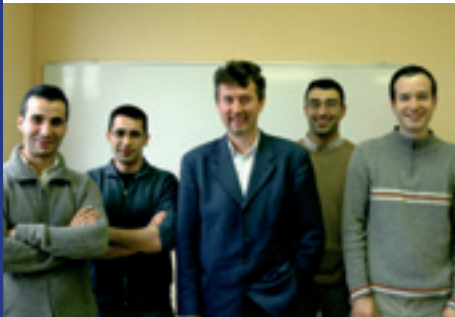
L'équipe de la Cellule «Garages» Het team van de cel «Garages»