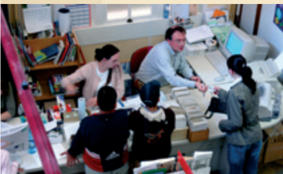
Un grand choix de livres pour tous Een grote keuze van boeken voor allen