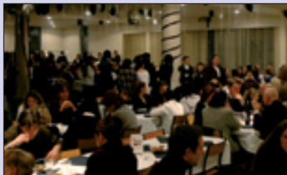
03/02 : Opération «Coup de Pouce» 03/02: Actie «Coup de Pouce»

3/2 : Actie «Coup de Pouce». Maaltijd om 19u, discoavond vanaf 21u. Sippelbergzaal (Sippelberglaan 1). Inl.: 02 411 18 73