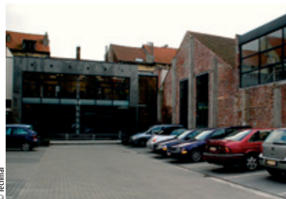
«Crystal Palace», de ideale plaats voor «Teleperformance»