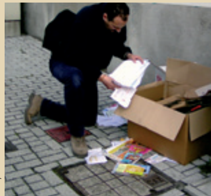
Les surveillants effectuent de nombreux contrôles De bewakers voeren talrijke controles uit

Het algemeen politiereglement geeft de cel ook het recht om repressief op te treden. Wanneer de inbreuken zich herhalen,