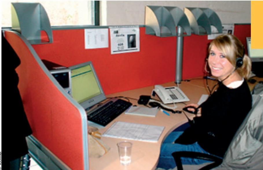
«Teleperformance», wereldleider op de markt van de call centers