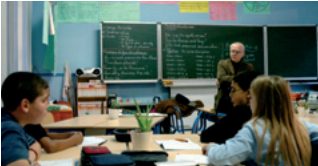
Atelier d'argumentation philosophique (Ecole 11) Atelier voor filosofische argumentatie ("Ecole 11")