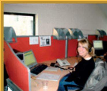
Teleperformance / Techmar