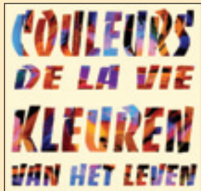
Exposition du 9/1 au 28/2 Tentoonstelling : 9/1 tot 28/2

9/1 au 28/2 : «Les Couleurs de la vie» - Exposition thématique de la Maison des Cultures (rue Mommaerts, 4). Tél.: 02 415 86 03