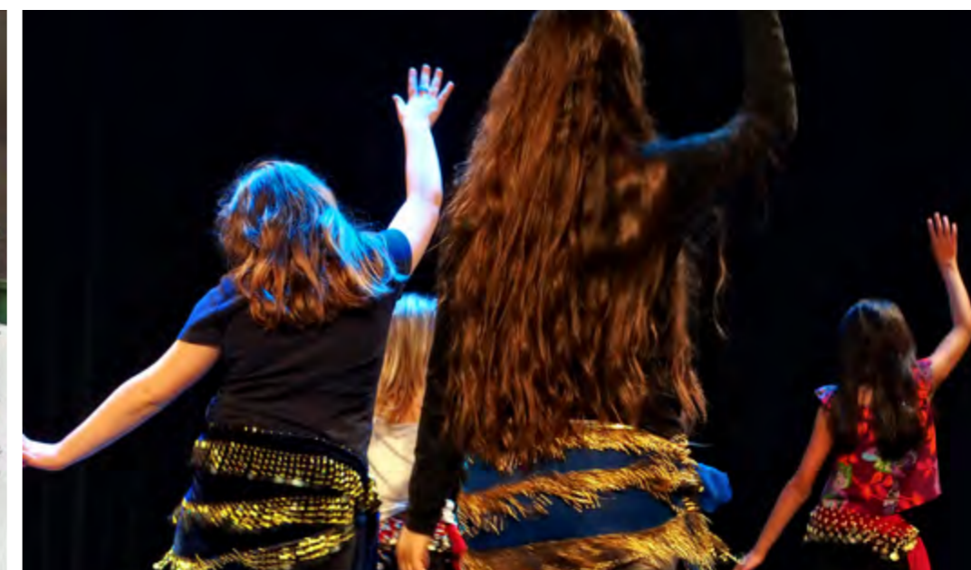
Danse orientale 8- 14 ans / jaar- Salwa- Maison des Cultures / Huis van Culturen