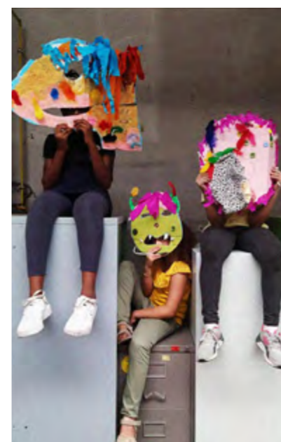
WAQ- Wijk Antenne de Quartier