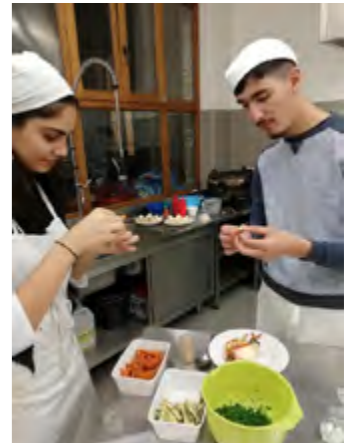
© Ateliers de cuisine durable #Imagine 1080

Participe au projet européen « FoodWave » ! | Neem deel aan het Europese project "FoodWave"!