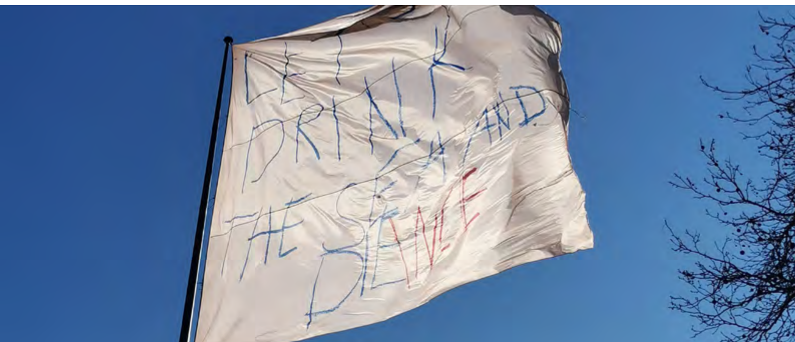
"Let's Drink the Sea and Dance" (drapeau / vlag 6,5x8m) 019 vzw- Philippe Vandenberg- Installation temporaire Porte de Ninove en 2021 / Tijdelijke installatie Ninoofsepoort 2021

Tout doucement, Molenbeek devient "the place to be" de la capitale. Chaque jour plus ancrée sur la carte de la culture et du sport, la commune est ouverte à tous, et attire les artistes et les jeunes entrepreneurs grâce à ses conditions accessibles.