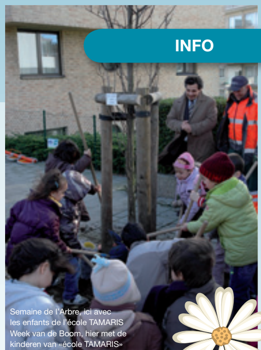
Semaine de l'Arbre, ici avec les enfants de l'école TAMARIS Week van de Boom, hier met de kinderen van «écolo TAMARIS»