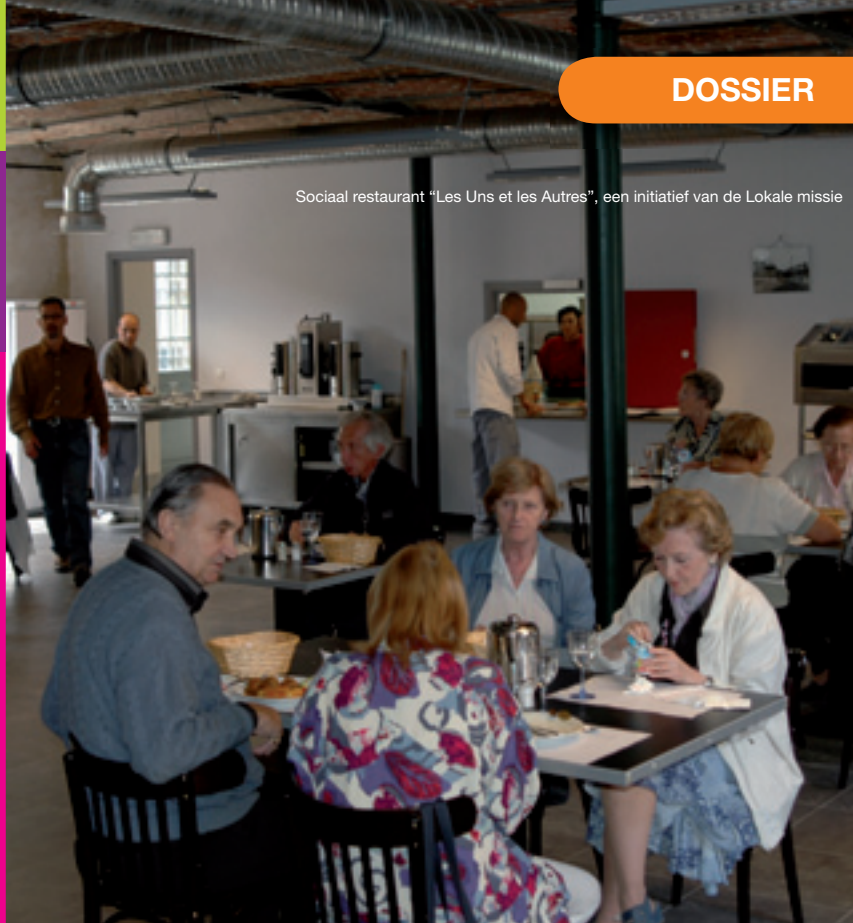
Sociaal restaurant “Les Uns et les Autres”, een initiatief van de Lokale missie