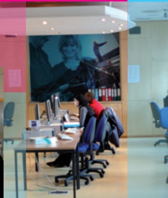
L'Espace Ressources Emploi d'Actiris (Rue Vandenoogaerde, 91).