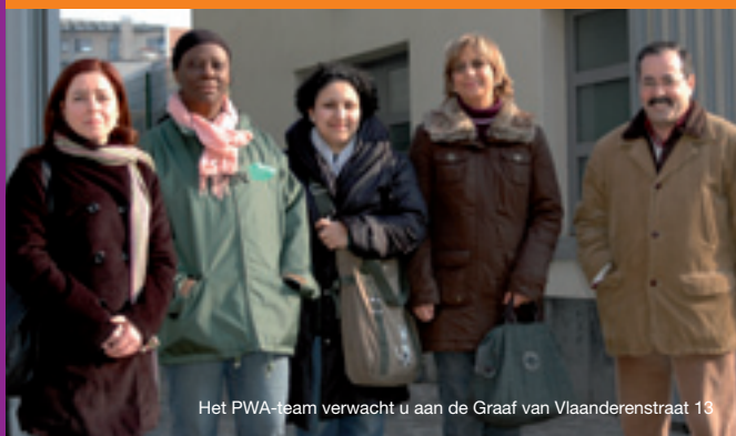
Het PWA-team verwacht u aan de Graaf van Vlaanderenstraat 13

! N.B. ! Nieuw adres: Graaf van Vlaanderenstraat 13. Tel.: 02 414 36 38 – Fax: 02 414 39 95 - ale.molenbeek.pwa@belgacom.net