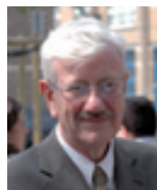
Philippe Moureaux, Bourgmestre Burgemeester