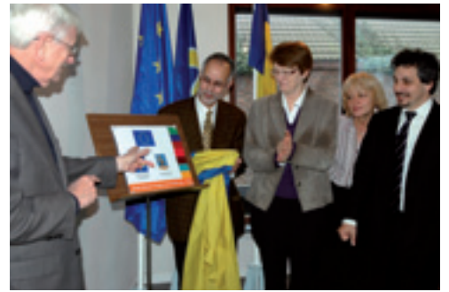
Inauguration de la crèche en présence de la Ministre Dupuis et du Collège Echevinal Inhuldiging van het kinderdagverblijf in aanwezigheid van Minister Dupuis en het Schepencollege

La gestion des appartements sera communale et leur attribution se fera aux conditions du logement social. Ce projet mixte a été lancé et financé à raison de 2.280.000€ environ par la Région bruxelloise et notre commune, dans le cadre du contrat de quartier et avec l'aide du programme européen «Objectif 2».