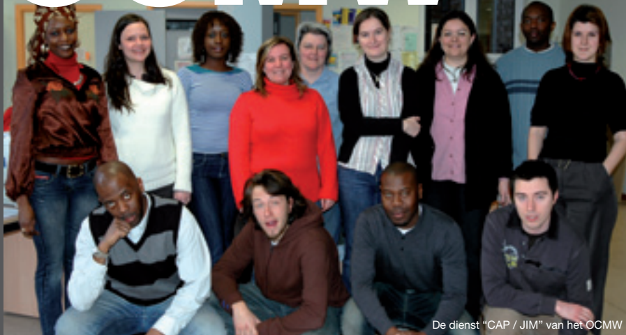
De dienst "CAP / JIM" van het OCMW