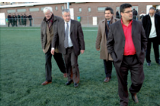
Le nouveau terrain synthétique du Sippelberg a été inauguré fin 2007 Het nieuwe synthetische terrein werd eind 2007 ingehuldigd

Van 2008 tot 2011 zal het Sippelbergstadion, met de financiële steun van het Brussels Gewest en onze gemeente, belangrijke verbouwingen ondergaan, om te voldoen aan de verwachtingen van de sporters uit Molenbeek. Overzicht van de toekomstige werken.