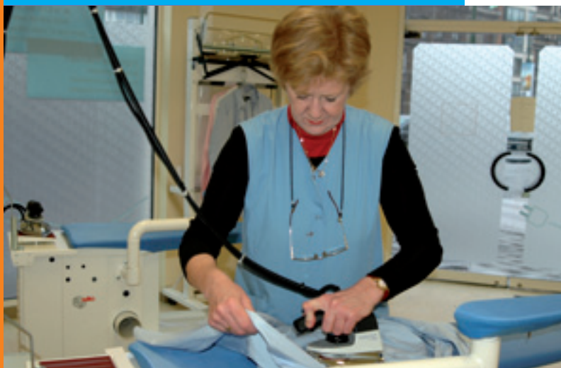
«A vos services» (l'atelier repassage au boulevard Léopold II, 50).