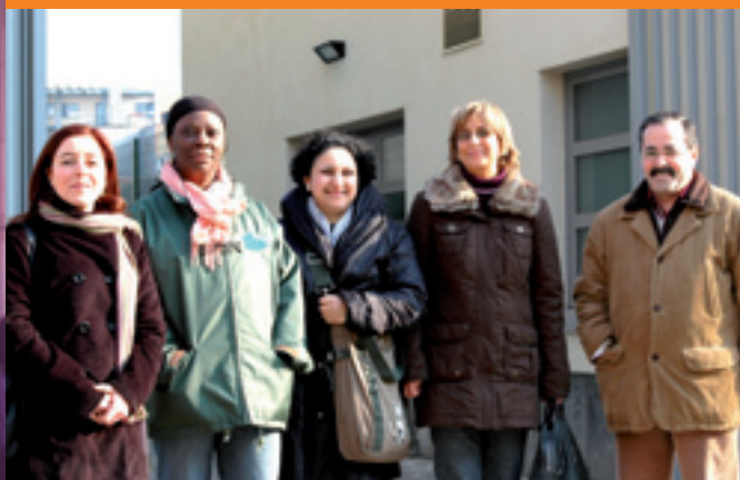
L'équipe de l'ALE vous attend à la rue du Comte de Flandre, 13

! Nouvelle adresse : rue du Comte de Flandre, 13. Tél.: 02 414 36 38 – Fax : 02 414 39 95 ale.molenbeek.pwa@belgacom.net