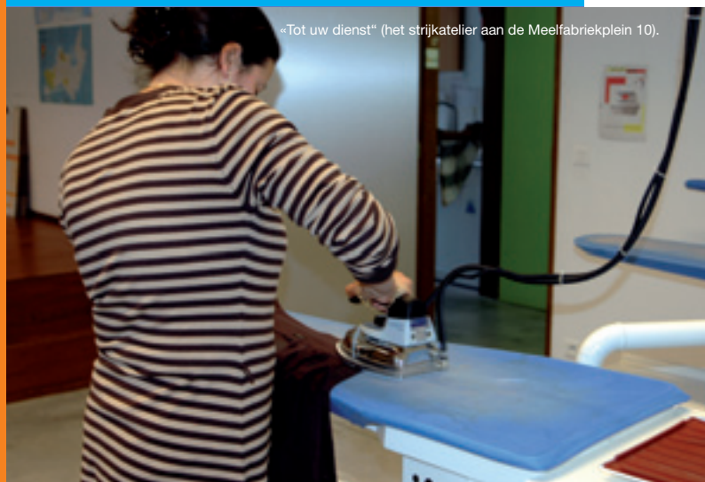
«Tot uw dienst» (het strijkatelier aan de Meelfabriekplein 10).