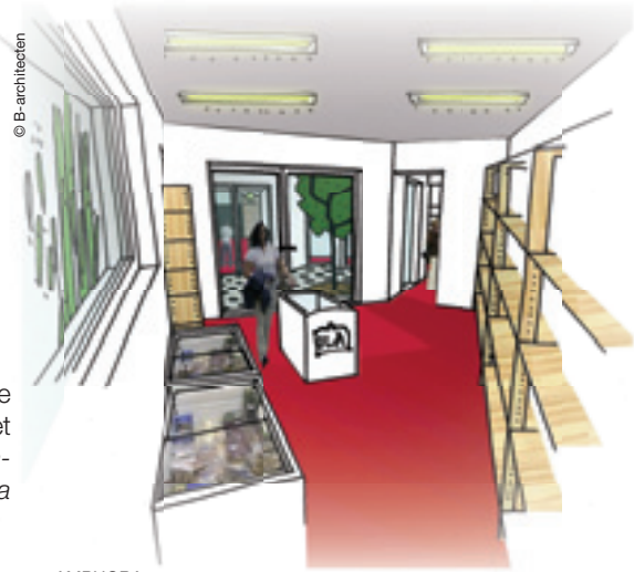
«AMPHORA», la future épicerie sociale de toekomstige sociale kruidenierswinkel

Pour favoriser les capacités de gestion et sensibiliser chacun à l'alimentation saine, des ateliers seront organisés à l'épicerie sociale et seront accessibles aux habitants du quartier et aux membres. Ouverture des portes prévue vers septembre 2008.