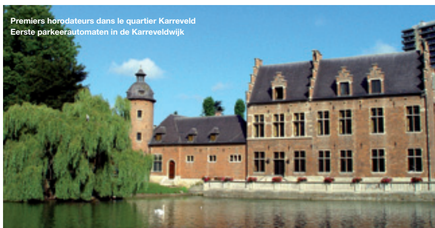
Premiers horodateurs dans le quartier Karreveld Eerste parkeerautomaten in de Karreveldwijk

bien visible sous son pare-brise pour permettre aux stewards de vérifier sa validité. Ce sésame permettra de stationner sans limite de temps dans les zones vertes mais attention, il n'est pas valable dans les zones rouges . Précisons bien qu'il y aura une phase d'information, puis de sensibilisation et de prévention avant d'arriver à d'éventuelles sanctions, conclut l'Echevin de la Mobilité.