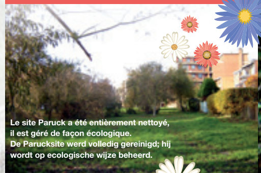
Le site Paruck a été entièrement nettoyé, il est géré de façon écologique. De Parucksite werd volledig gereinigd; hij wordt op ecologische wijze beheerd.