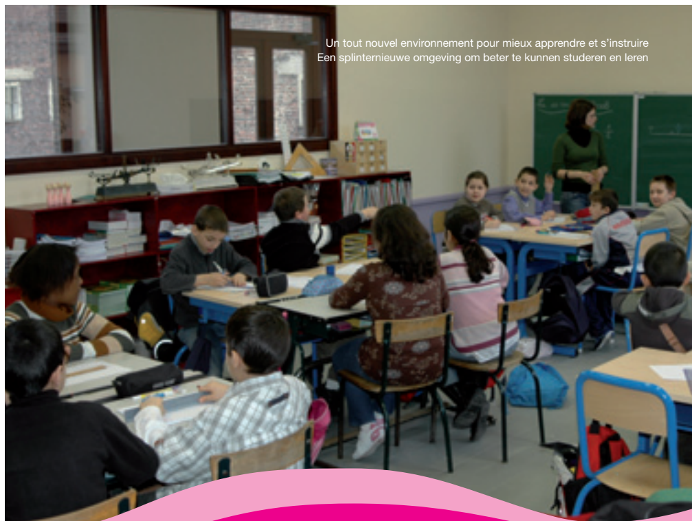
Un tout nouvel environnement pour mieux apprendre et s'instruire Een splinternieuwe omgeving om beter te kunnen studeren en leren

De onderwijzers en leerlingen van Franstalige gemeenteschool nr. 2 hebben hun nieuwe lokalen na de krokusvakantie geïntegreerd terwijl de terugkeer van de Nederlandstalige gemeenteschool «Regenboog» naar de gerenoveerde infrastructuur in de Ulensstraat stap voor stap zal gebeuren na Pasen.