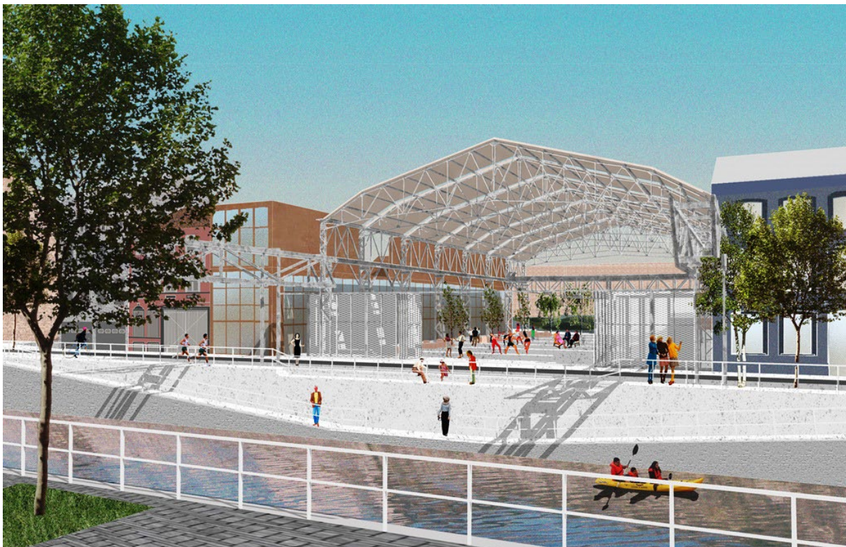
© tijdelijke vereniging ZAmphone - L'escout

Voor meer informatie kunt u terecht bij: Eve Deroover, Persdienst van de Gemeente Sint-Jans-Molenbeek (02 600 74 09 + 0479 21 71 77 + ederoover@molenbeek.irisnet.be )