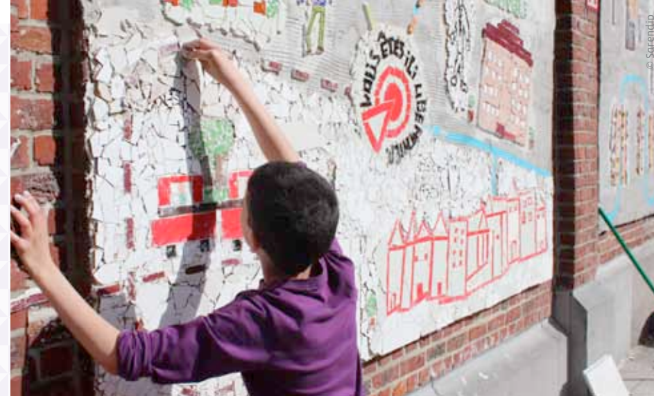
Jeune du quartier participant à la création de la mosaïque imaginée par Sarendip / Jongere uit de wijk die deelnam aan de mozaïek verondersteld door Sarendip (n°14)