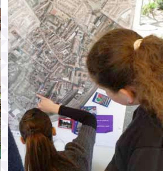
Habitants participant au jeu « les Experts du quartier » lors de la fête du parc de la Fonderie / Bewoners die deelnemen aan het spel « Wijk Expert » gedurende de Gietrijpark