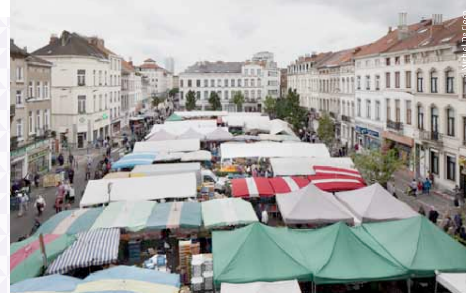
Le célèbre marché du jeudi sur la place communale de Molenbeek-Saint-Jean / De bekende donderdagmarkt op de gemeenteplaats van Sint-Jans-Molenbeek