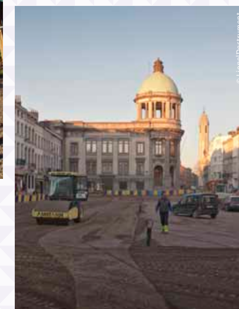
Place communale et plein chantier / Werken op de gemeenteplaats