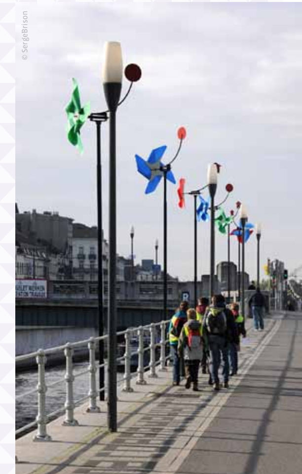
Vue des moulins le long du quai des charbonnages / Zicht op de molen langs de Koolmijnenkaai