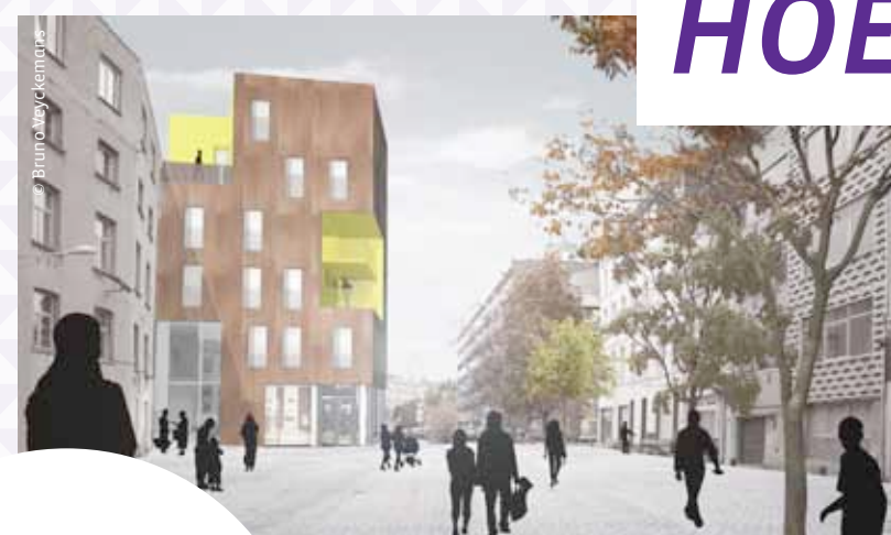
Logements et rez-de-chaussée commerciaux à l'angle de la rue du comte de Flandre et de la chaussée de Gand / Woningen en handelsruimtes op de hoek van de Graaf Van Vlaenderstraat en de Gentsesteeweg