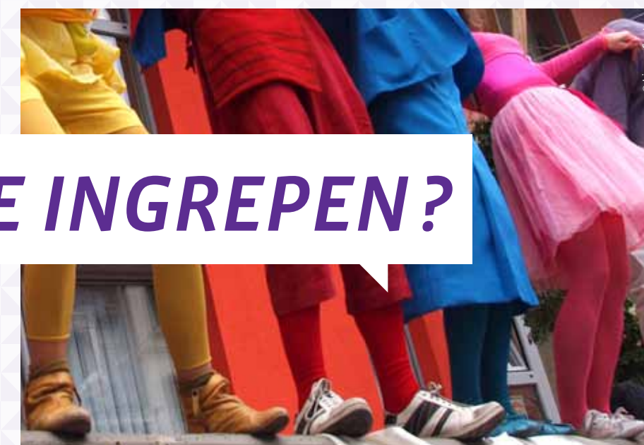
Les Artistes du Collectif Auquai durant la fête de quartier l'Espoir en 2011 / De artiesten van het Collectief Auquai tijdens het wijkfeest l'Espoir in 2011