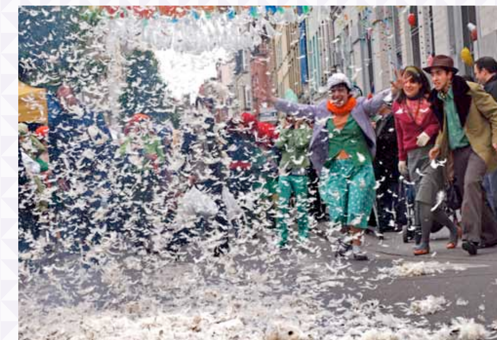
Soumance de la zinneke Parade durant la Ransfesta en 2010 / Soumance van de Zinneke Parade tijdens de Ransfesta in 2010