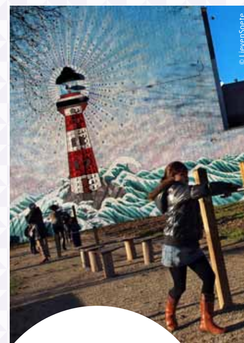
Nouvelle fresque et parcours santé pour le parc Pierron / Nieuwe fresco en gezondheidspad voor het Pierronpark (n°9)